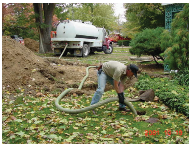
Autoespurgo periodico di fossa biologica